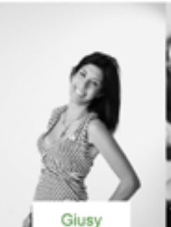
Giusy Rindone Scenografia