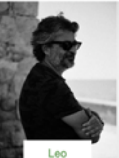
Leo Dominici Scenografia