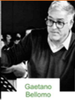
Gaetano Bellomo Musica originale